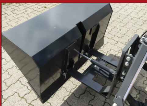
Den robuste og dog stadig kompakte opbygning sikrer høj nyttelast og lav egenvægt