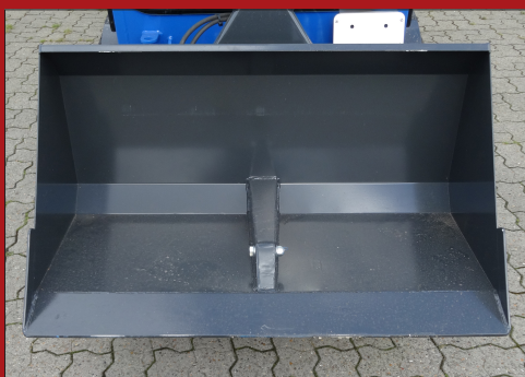
Skovlen er opbygget, så der kan arbejdes helt til kant, så arbejdsbredden udnyttes optimalt